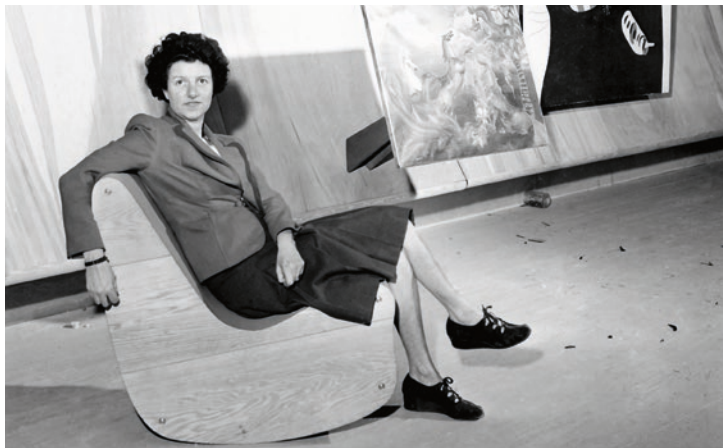
Peggy Guggenheim, around 1942 in her New York Gallery Art of This Century