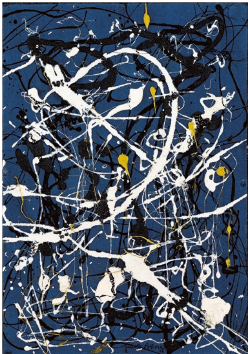
Jackson Pollock, Composition No. 16 , 1948