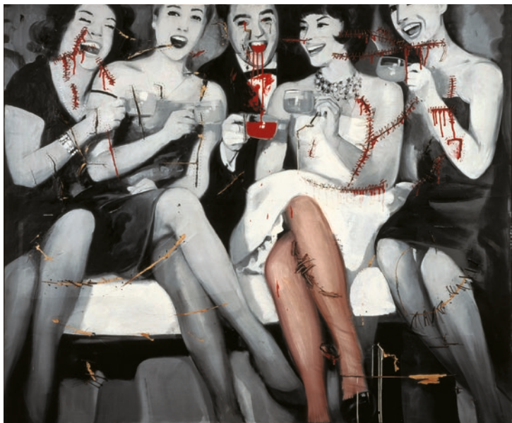
Gerhard Richter, Party , 1963