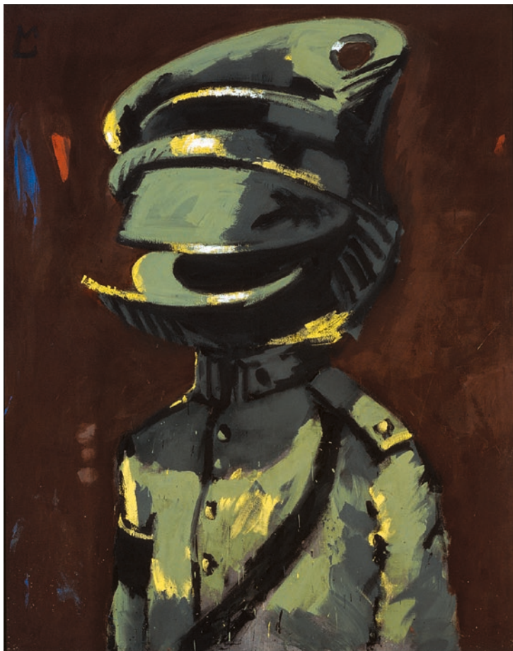
Markus Lüpertz, Zyklop I – dithyrambisch , 1973

qui inspectent de manière critique le musée et ses chefs-d'œuvre classiques. La fiction : Une nouvelle situation de dialogue qui joue sur le subjonctif du « Que se passerait-il si » d'un avenir radicalement modifié.