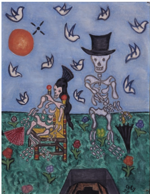
William N. Copley, Untitled (Skeletons) , 1958