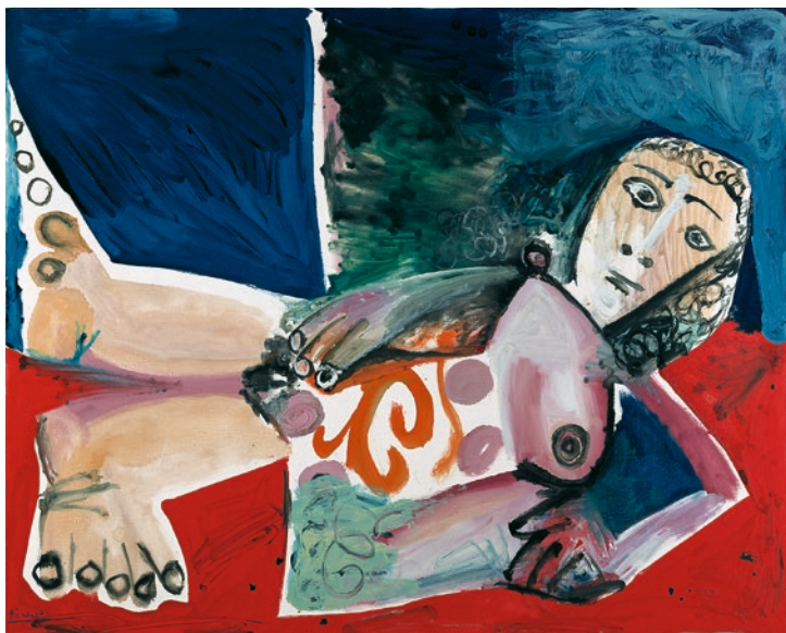
Pablo Picasso, Nu couché , 1968

L'automatisation de la vie, la transformation de nos environnements sociaux se poursuit. L'intelligence artificielle et ses promesses prennent le relais et créent des formes d'existence semblables à la vie. L'homme pousse au progrès - et se trouve depuis longtemps au seuil de sa propre remplaçabilité. Avec l'exposition « Transformers », le musée Frieder Burda tente une expérience et se transforme en un dispositif expérimental hybride et utopique. Il thématise et présente des êtres artificiels