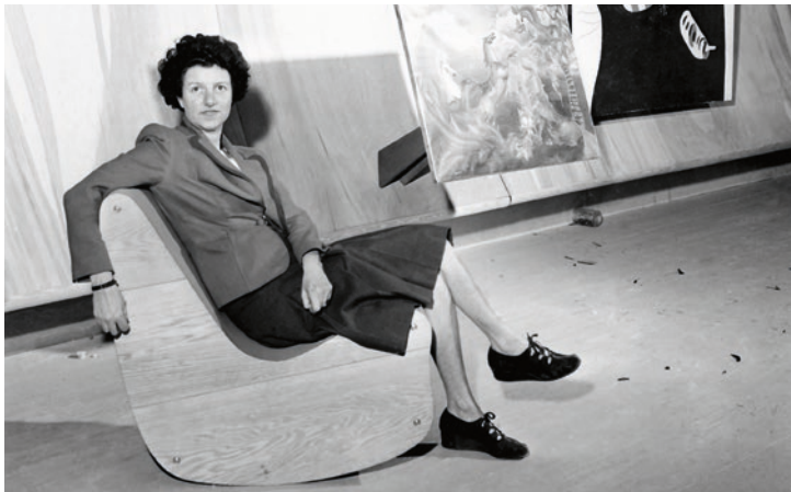
Peggy Guggenheim, around 1942 in her New York Gallery Art of This Century